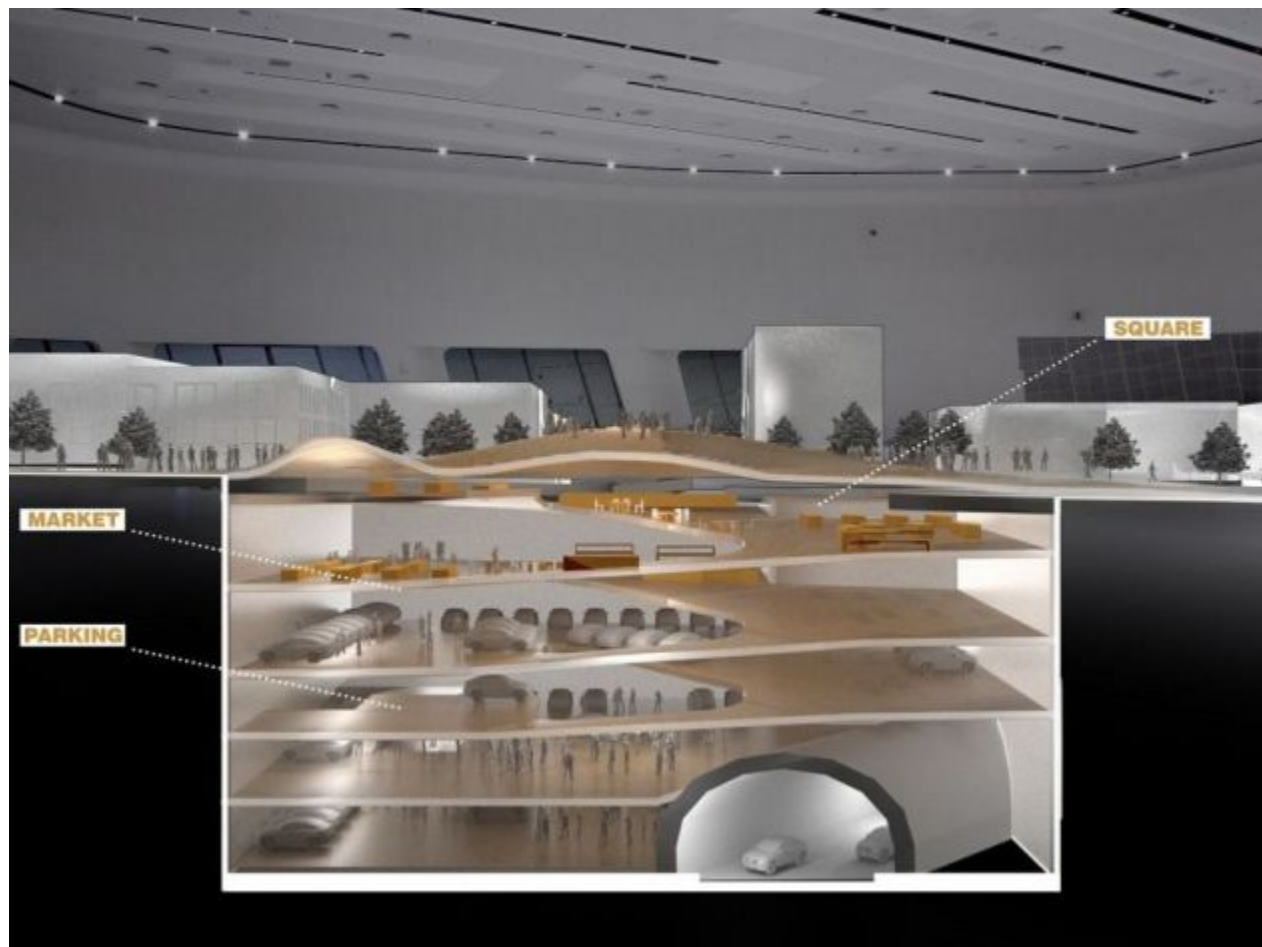
Trg u Palmotićevoj sa podzemnom pijacom

- Osmislili smo višeprogramske objekte koji, osim parkiranja i vertikalne komunikacije, u sebi imaju tržnice, data skladišta, prostore kulture, pa i parkove. Primeri objekata koji zauzimaju podzemne prostore ili su na neki način intervencija u njima, mogu se naći širom sveta – međutim, nigde se oni ne nalaze kao jasna gradska strategija i u tome je prilika da Beograd ovaj model iret adaptira kako za tunele, tako i za metro stanice.